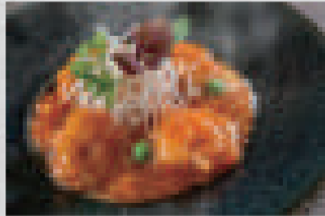
海老のチリソース煮 1050 (ご飯・デザート付き) Shrimp in chili sauce (includes white rice and dessert)