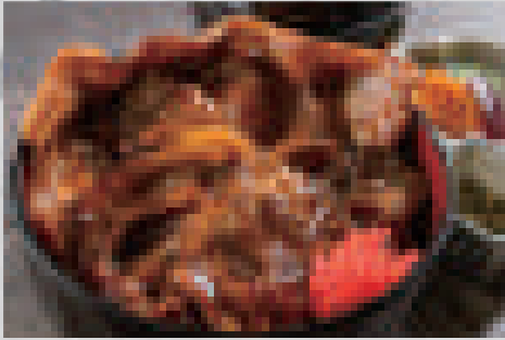
道産三元豚の炙り豚丼 980 Hokkaido sangenton pork rice bowl