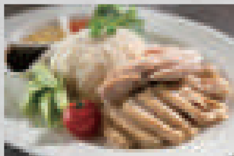
海南鶏飯 980 シンガポールチキンライス Singapore-style chicken rice