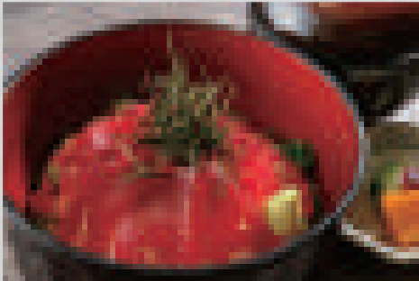
漬けまぐろ丼 980 Marinated tuna rice bowl