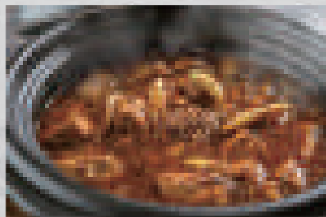
陳麻婆豆腐(ご飯付き) 880 (大盛りプラス100) Chen mapo tofu (includes white rice) (extra-large portion: +100)