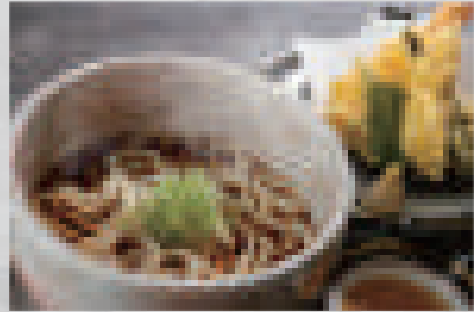
天婦羅うどん (温) 880 (大盛りプラス100) Tempura udon (hot) (extra-large portion: +100)