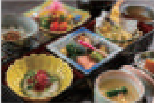
嵐山御膳 (デザート・コーヒー付)

Arashiyama set meal with dessert and coffee