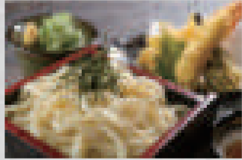
天婦羅うどん (冷) 880 (大盛りプラス100) Tempura udon (cold) (extra-large portion: +100)