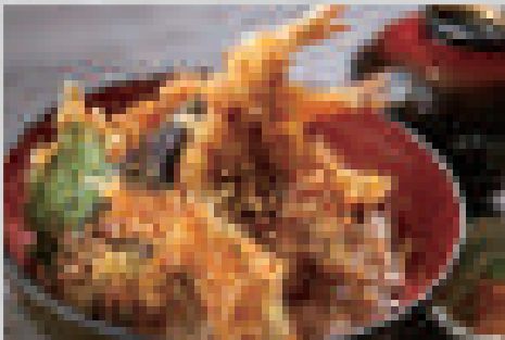
天丼 980 Tempura rice bowl