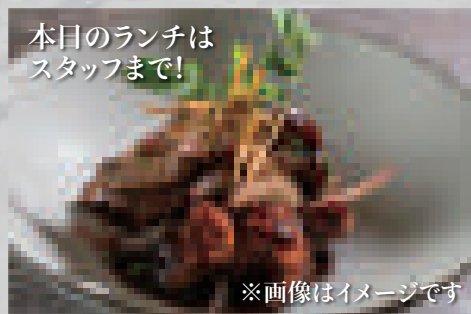
本日のランチはスタッフまで! 日替わりランチ(ご飯付き) 880 Today's set lunch (includes white rice)