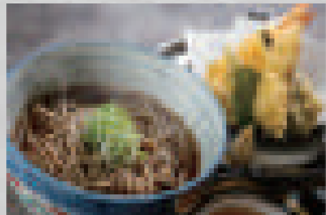
天婦羅そば (温) 880 (大盛りプラス100) Tempura soba (hot) (extra-large portion: +100)