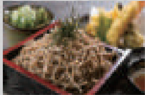
天婦羅そば (冷) 880 (大盛りプラス100) Tempura soba (cold) (extra-large portion: +100)