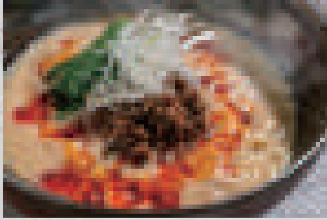
白胡麻の担々麺 980 (大盛りプラス100) White sesame dandan noodles (extra-large portion: +100)