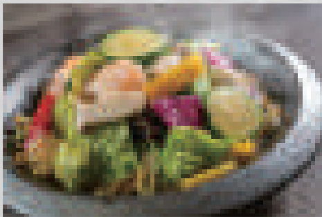
大地の恵み塩あんかけ焼きそば 980 (大盛りプラス100) Salted ankake yakisoba with vegetables (extra-large portion: +100)